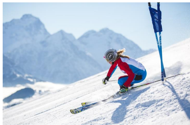
Martin Fourcade et Ophélie David, 2 des 15 athlètes soutenus par Club Med lors des Jeux Olympiques d'Hiver à PyeongChang (Corée du Sud)

Dans le cadre de son partenariat avec le Comité National Olympique et Sportif Français (CNOSF) , Club Med s'engage auprès des athlètes français sélectionnés aux Jeux Olympiques d'Hiver à PyeongChang, en Corée du Sud, qui débutent ce vendredi 9 février. Les 15 resorts Montagne des Alpes françaises soutiendront respectivement 15 athlètes.